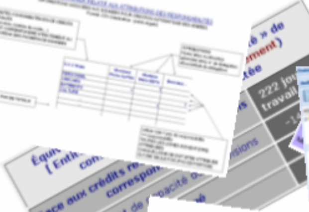
TABLEAU DE BORD RELATIF AU FONCTIONNEMENT DES SERVICES